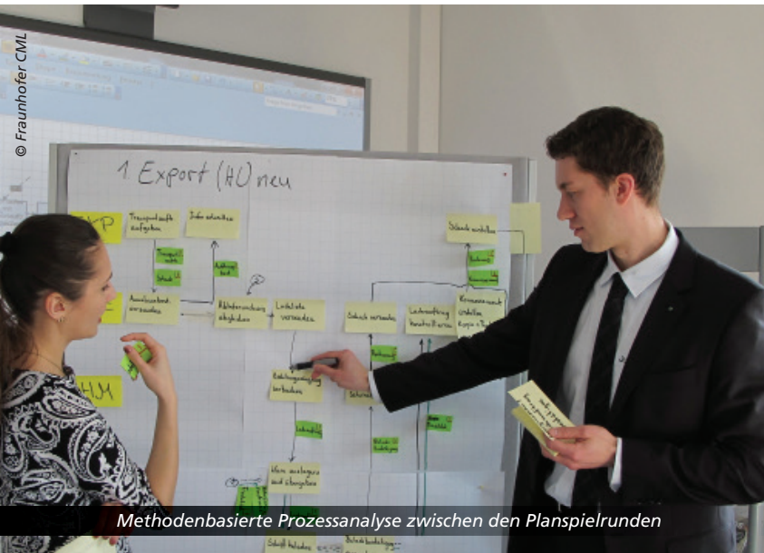
Methodenbasierte Prozessanalyse zwischen den Planspielrunden