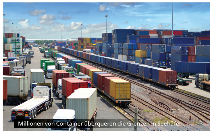
Millionen von Container überqueren die Grenzen in Seehäfen

Eine C-BORD-Toolbox und ein Rahmenwerk sollen dem Zoll in Zukunft helfen, den Bedarf an Container-NII zu analysieren, integrierte NII-Lösungen zu entwerfen, und Antworten auf wichtige funktionale und sicherheitstechnische Fragen geben.