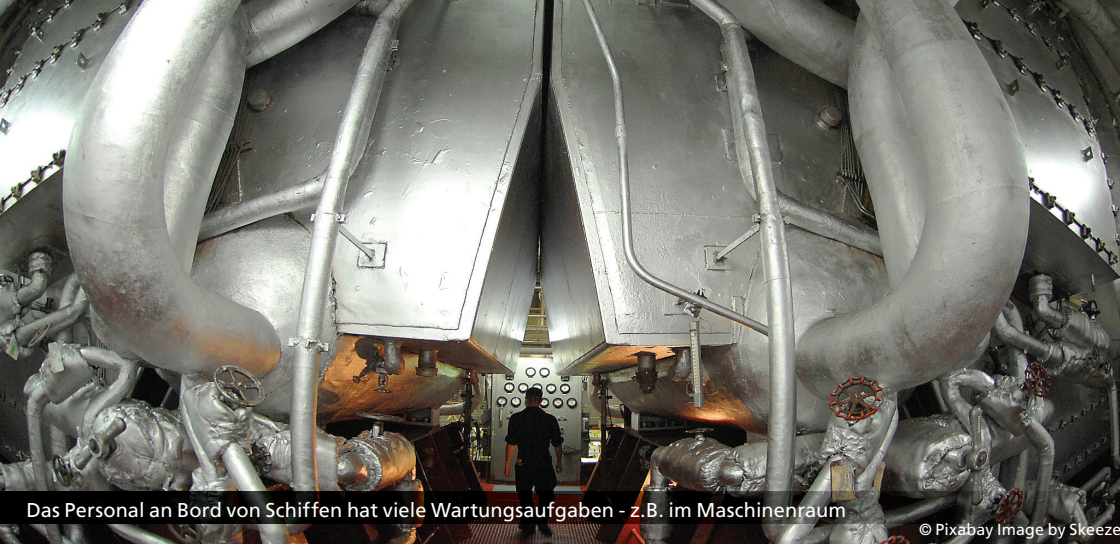
Das Personal an Bord von Schiffen hat viele Wartungsaufgaben - z.B. im Maschinenraum